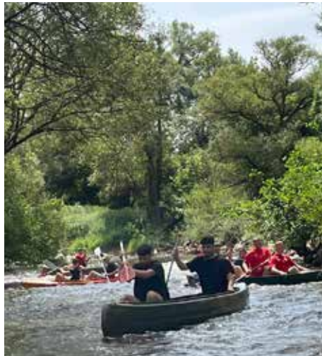
Teamevent – Kanufahrt

Cleverfit - VK Bodyfit GmbH in Bad Kreuznach durchgeführt. Zusätzlich konnten unsere Jungs bei einer Kanutour den Teamgedanken stärken und bei bestem Wetter auch eine kleine Abkühlung genießen. Mit einem guten Gefühl gehen wir in die neue Saison und wünschen allen Mannschaften, Trainern und Verantwortlichen ein gutes Gelingen.