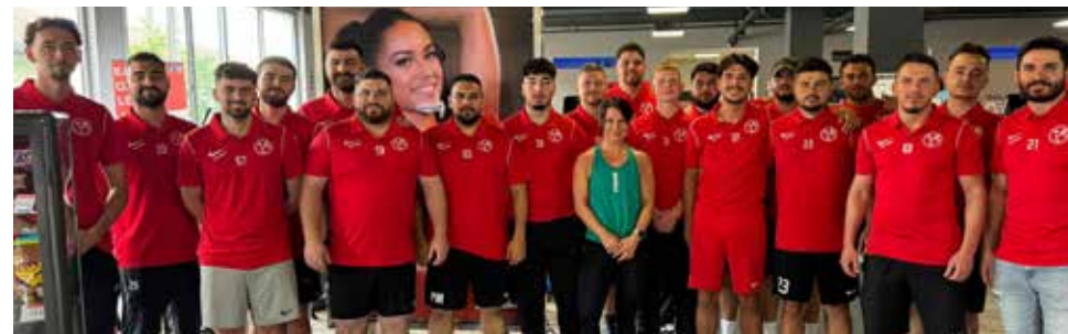
Trainingseinheit bei Cleverfit